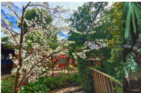
รับประทานอาหารเที่ยง อิสระอาหารกลางวัน ณ คาเฟ่ อาคารจักรบ้อง